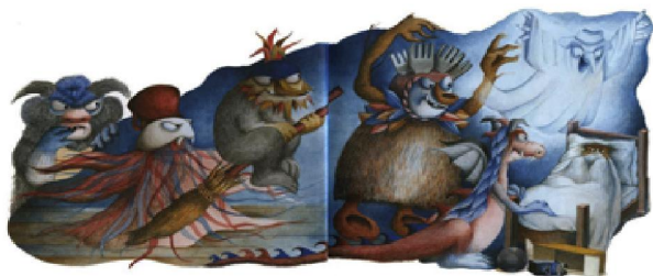
Ilustración del texto Tengo miedo , de Ivar Da Coll.

De manera espontánea y sin presión, surgen las historias de los niños y se tejen entre sí. Con una cámara de video o un teléfono celular se puede registrar este conjunto de creaciones de la primera infancia.